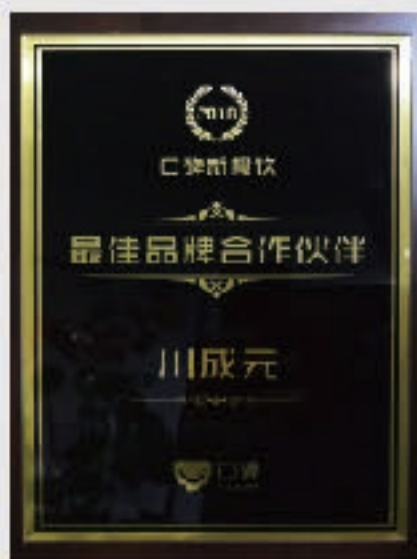
荣获2018年度口碑最佳品牌合作伙伴