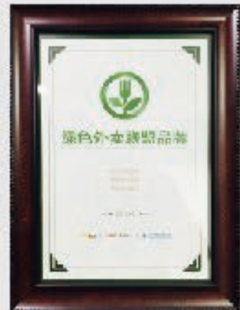
荣获2017年度绿色外卖联盟品牌奖