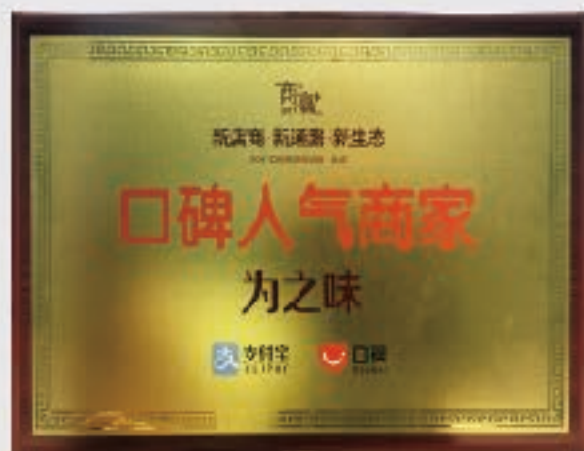
荣获2017年度口碑人气商家奖