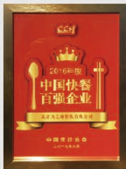
荣获2016/2017年度中国快餐百强企业