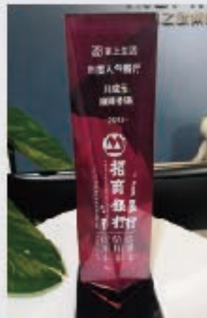
荣获2018年度掌上生活人气餐厅奖